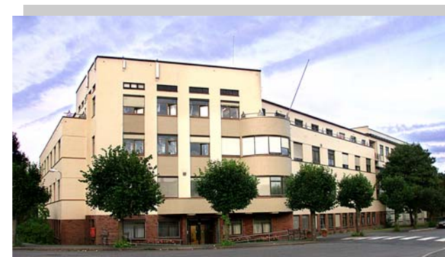
Betanien Hospital Skien